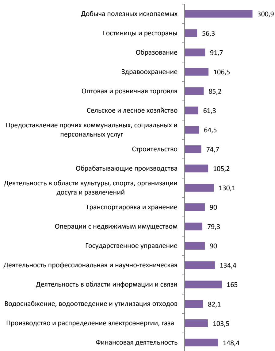
РИСУНОК 2. Межотраслевая дифференциация средней заработной платы в феврале 2019 г. в Санкт-Петербурге, в % к среднему уровню (средняя заработная плата = 100%)