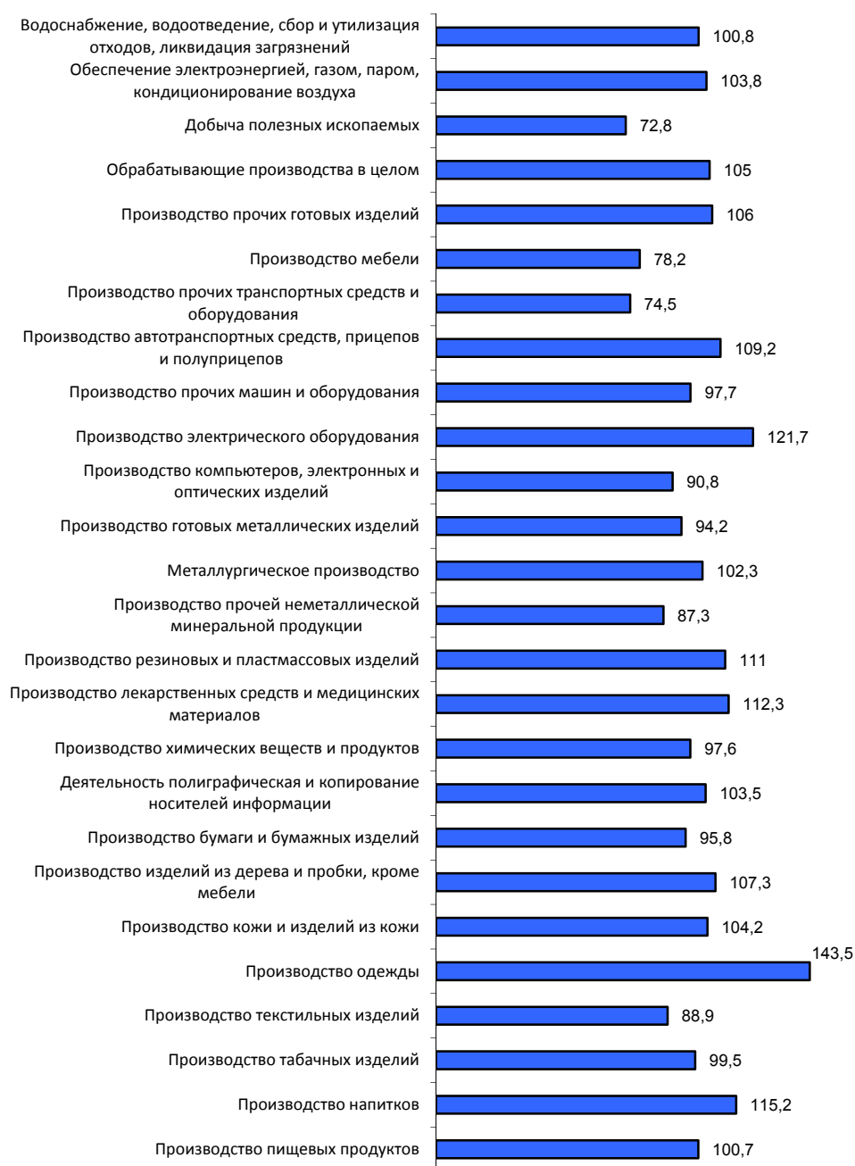
РИСУНОК 3. Динамика объема производства продукции по отраслям промышленности в Санкт-Петербурге, январь-март 2019 г. в % к январю-марту 2018 г.